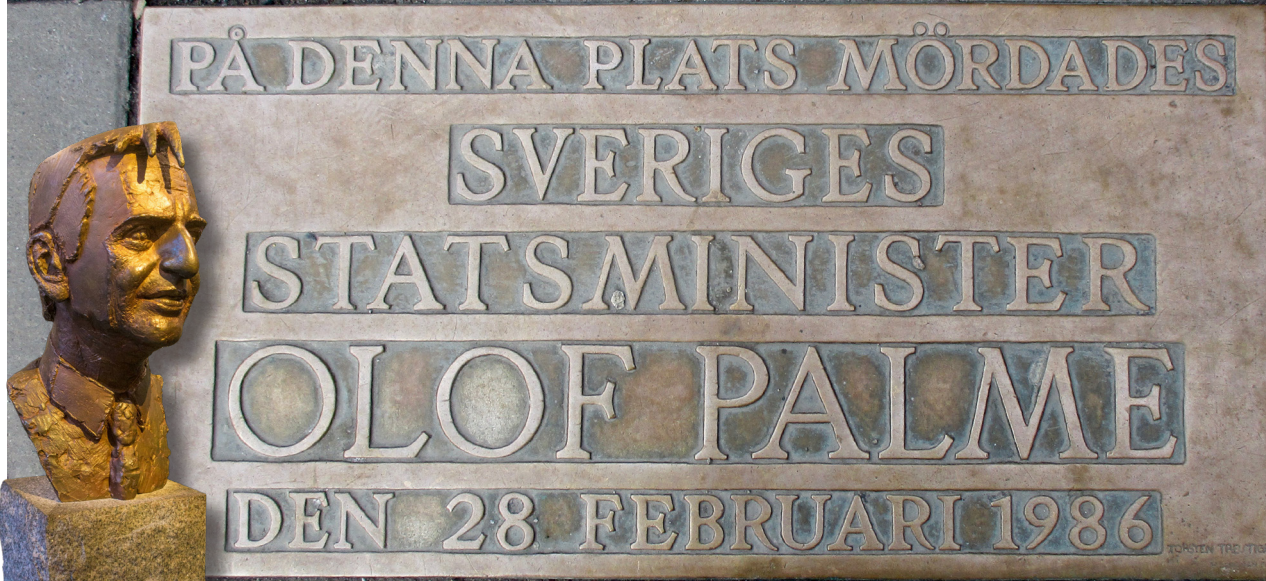
Staty av Olof Palme i Riksdagshuset.