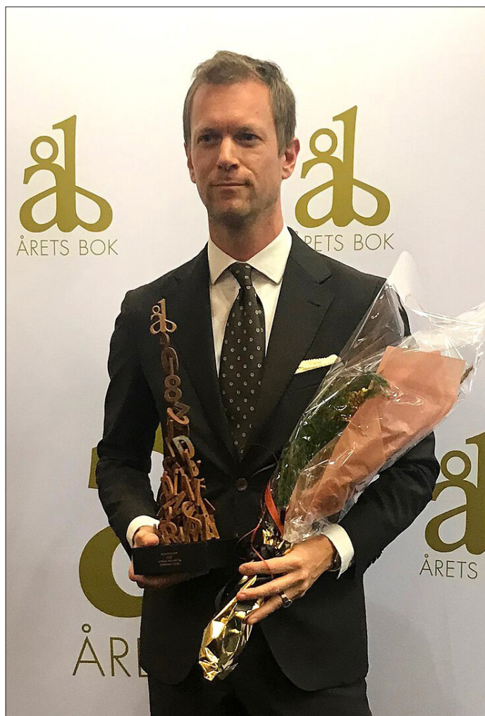
Niklas Natt och Dag mottog priset för Årets bok år 2018.

Niklas Natt och Dag bokdebuterade 2017 med romanen 1793, den första delen i trilogin Bellman noir. Boken utsågs till Årets bästa svenska debut 2017 av Svenska Deckarakademin. På 2018 års Bokmässan i Göteborg tilldelades boken även Crimetime Specsavers Award för bästa deckardebut, samt röstades fram till Årets bok i Bonniers Bokklubbers årliga tävling. Rättigheterna till boken har sålts till över 30 länder.