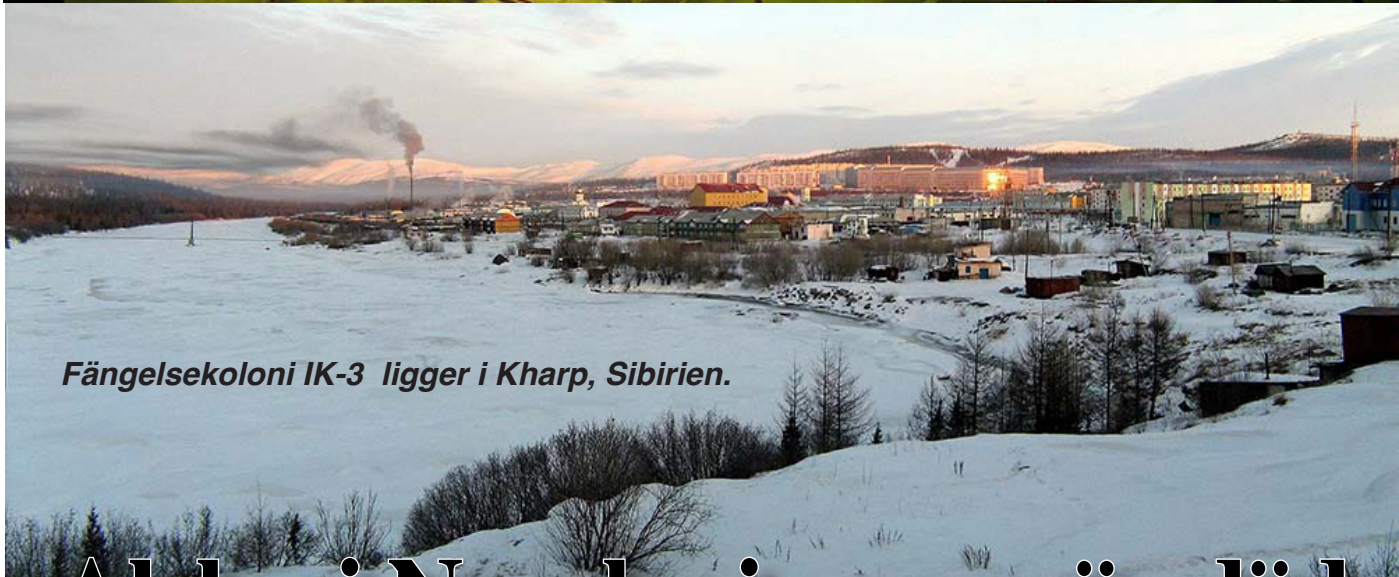
Fängelsekoloni IK-3 ligger i Kharp, Sibirien.