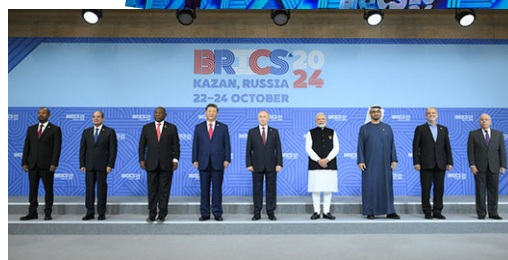
Gruppfoto av delegationschefer.