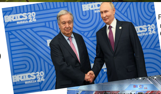
FN:s generalsekretärer António Guterres skakar hand med Putin.

Allt medan majoriteten kämpar på, åter havregrynsgröt och tror att det blir bättre och bättre dag för dag.