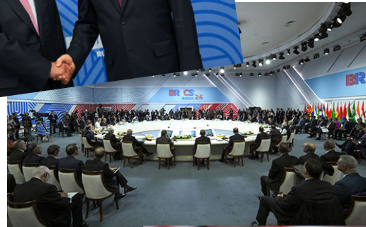
Venezuela president Nicolas Maduro var också där.